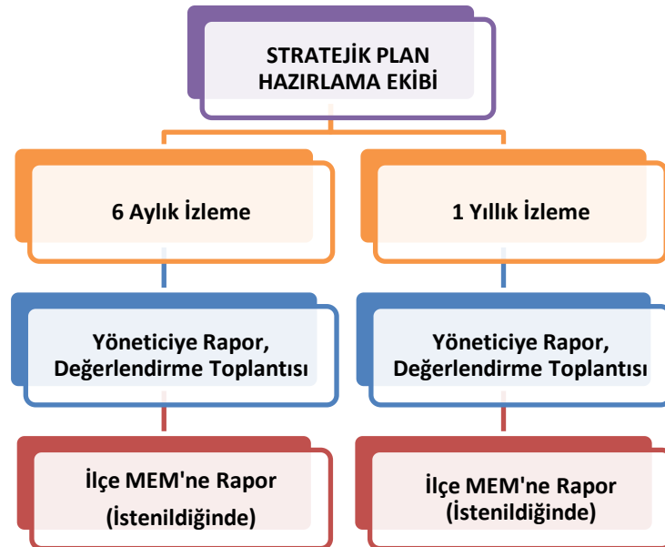
Şekil 2 İzleme ve Değerlendirme Süreci

Müdürlüğümüzün 2024-2028 Stratejik Planı İzleme ve Değerlendirme sürecini ifade eden İzleme ve Değerlendirme Modeli hazırlanmıştır. Okulumuzun Stratejik Plan İzleme-Değerlendirme çalışmaları eğitim-öğretim yılı çalışma takvimi de dikkate alınarak 6 aylık ve 1 yıllık sürelerde gerçekleştirilecektir. 6 aylık sürelerde Okul Müdürüne rapor hazırlanacak ve değerlendirme toplantısı düzenlenecektir. İzleme-değerlendirme raporu, istenildiğinde İlçe Milli Eğitim Müdürlüğüne gönderilecektir.